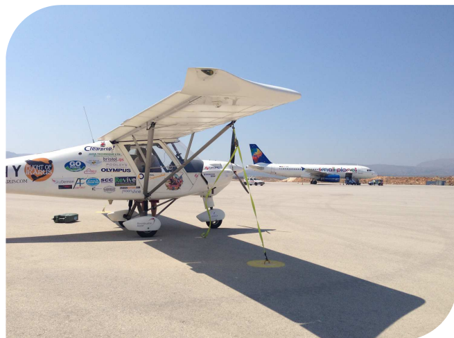
Bild: G-CFIJ / Sitia, Kreta