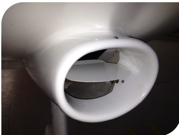
Bild: Kühlerklappe C42B